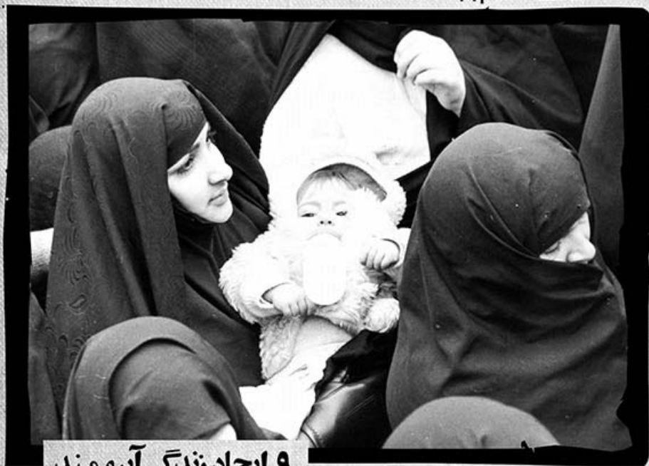
۹. ایجاد زندگی آبرومند