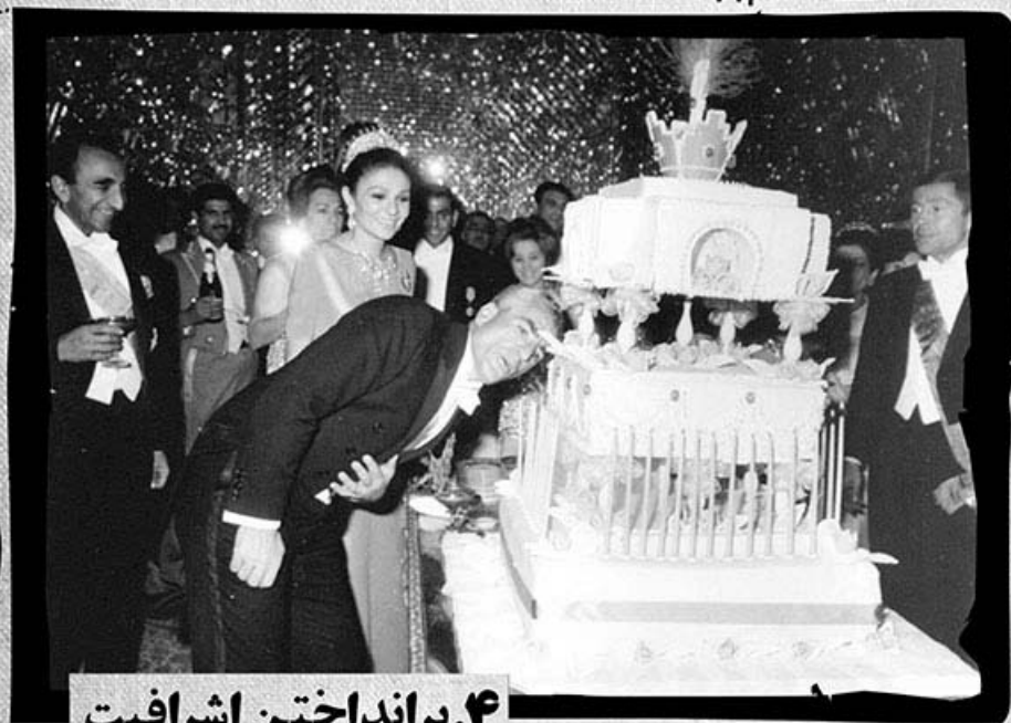
۴. برانداختن اشرافیت