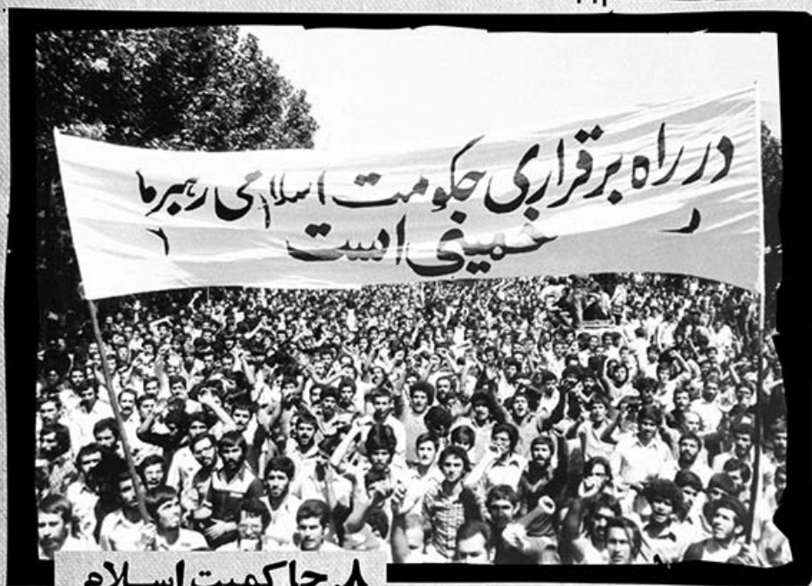
۸. حاکمیت اسلام