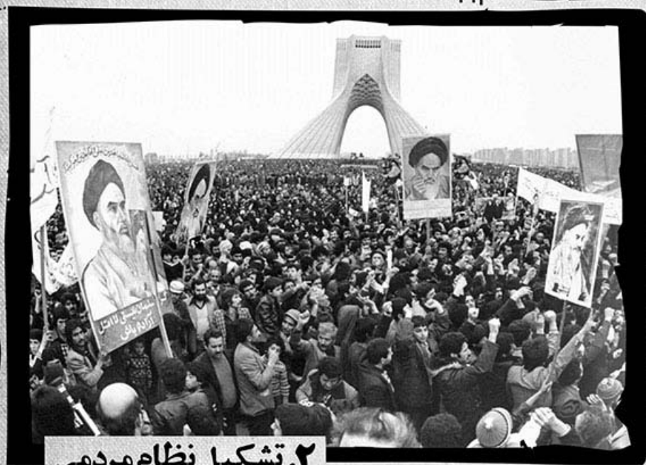
۲. تشکیل نظام مردمی