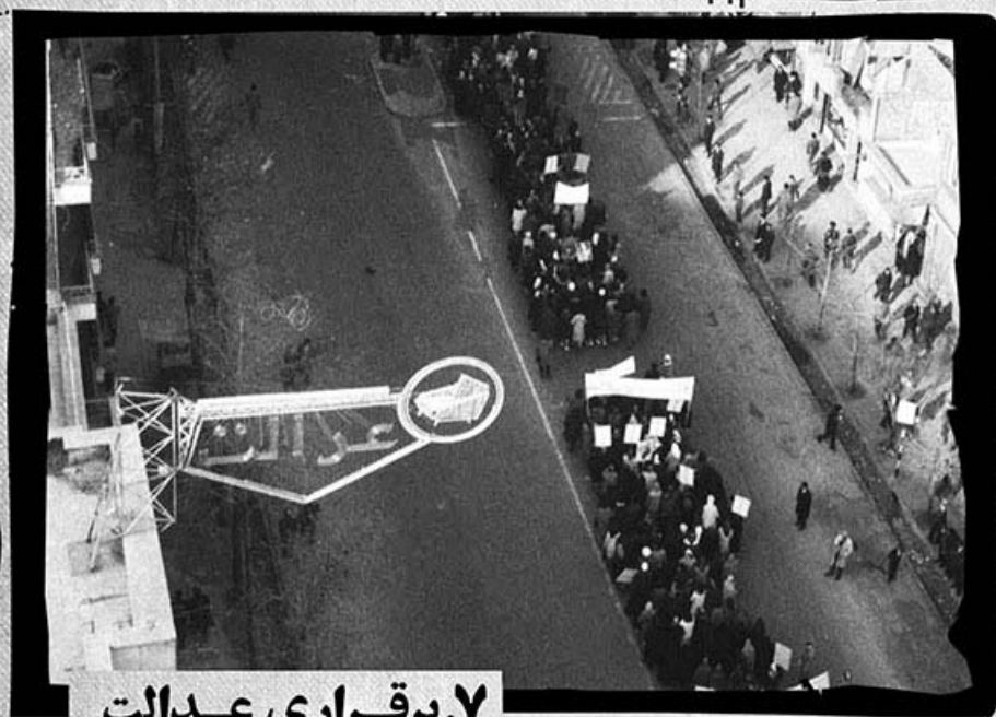
۷. برقراری عدالت