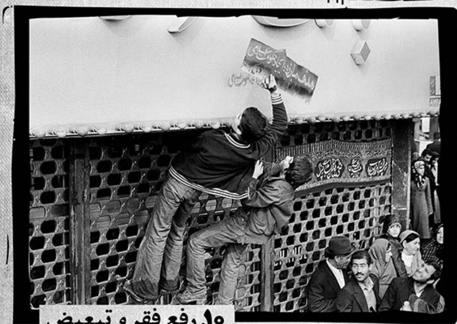
۱۰. رفع فقر و تبعیض